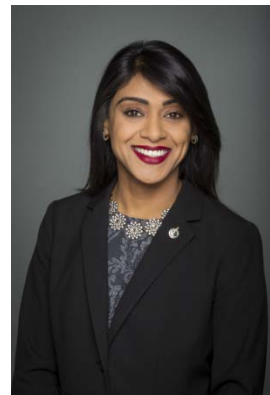
L'honorable Bardish Chagger

Ministre de la Petite Entreprise et du Tourisme