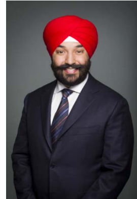
L'honorable Navdeep Bains

Le premier ministre et le président du Conseil du Trésor cherchent à simplifier et à rendre plus efficaces les processus redditionnels de manière à ce que le Parlement et les Canadiens puissent suivre les progrès du gouvernement dans ses efforts pour offrir de réels changements à la population. À l'avenir, les rapports de l'Agence canadienne de développement économique du Nord au Parlement seront davantage axés sur la transparence en ce qui a trait à la