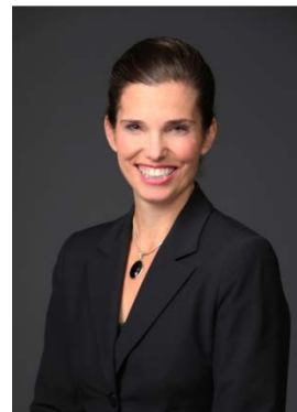
L'honorable Kirsty Duncan

Ministre de l'Innovation, des Sciences et du Développement économique